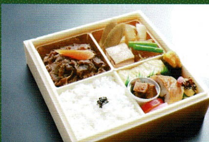
牛すき焼き弁当 2,500円