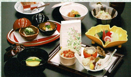
写真は雪会席です