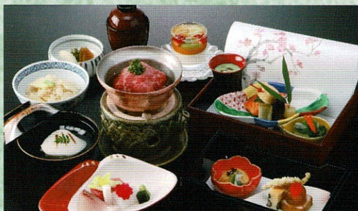
写真は木蓮プランです